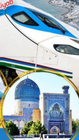
ทูรี อามิรี