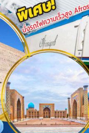
จัตุรัสเรจิสถาน