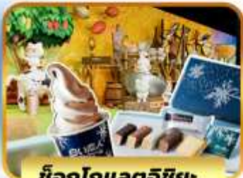
ชีสไอศกรีมและดีชีส