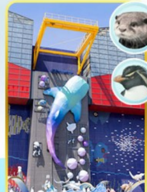
พิพิธภัณฑ์โคยูกิจ

🍷 ออนเซ็น 1 คั้น 🚽 นน.กระบะเป่า 1 ใบ 23 กก. ☀️ 7Days 5Night