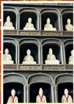
วัดไดชิซังเซโอดิจิ