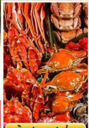
ปิ้งย่างพรีเมียม