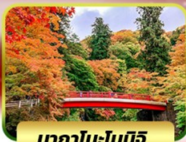
นากาโนะโมมิจิ