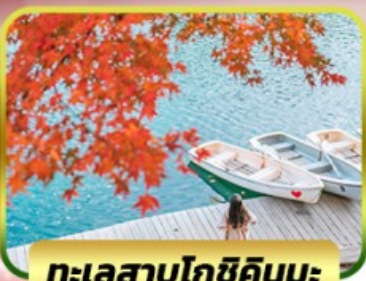
ทะเลสาบโกชิคิคุมะ