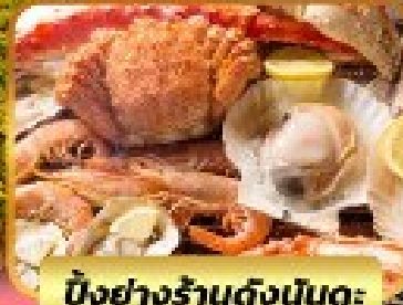
บิงย่างร้านดังเน้นตะ