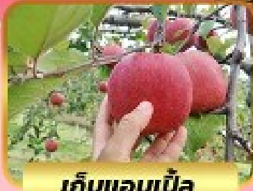
เก็บแอมเปิ้ล