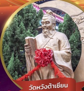
วัดหวงต้าเซียน