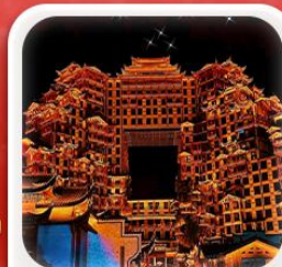
“ตึกมหัศจรรย์ 72 ชั้น”