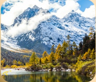
“ปี้ฝิงโกว”

ชมธรรมชาติ 2 อุทยานขึ้นชื่อ อุทยานภูเขาสี่ครุณี + อุทยานปี้ฝิงโกว สะพานหนานเฉียว • ถนนคนเดินไท่กู่หลี่ + ซุนซีลู่ + Pop Mart • ดงเจียวจื่อ