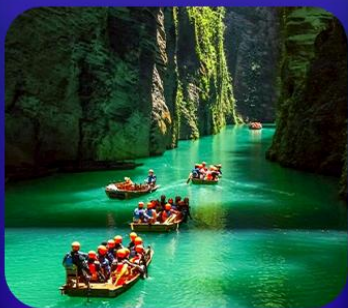
“ ผิงซานแกรนด์แคนยอน ”

เที่ยวจีน 2 มณฑล เสฉวน+หูเป่ย์ • ถ้าเถิงหลง • หุบเขาสิงโต ซื่อจื่อกวน ล่องเรือมังกรกังส่วยชมวิวยามค่ำคืน • ผิงซานแกรนด์แคนยอน (รวมล่องเรือ) หงหยาดัง • จุดชมรถไฟฟ้าทะเลสาบ • ตึกตะเกียบ • สือปาตี้ • หลงเหมินฮ่าว