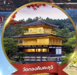
วัดทองคินคะคุจิ

"เข้าไอซาก้า ออกโตเกียว เที่ยวสบายไม่ย้อนทาง"