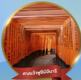
ศาลเจ้าฟูชิมิอินาริ