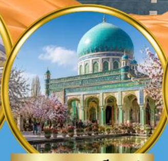
สุสานสมหอมเซียนเฟย