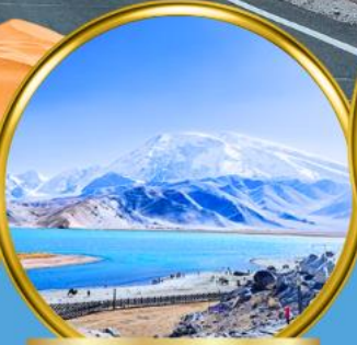
Kala Kule Lake