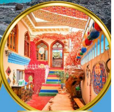
เมืองเก่าคัชการ์