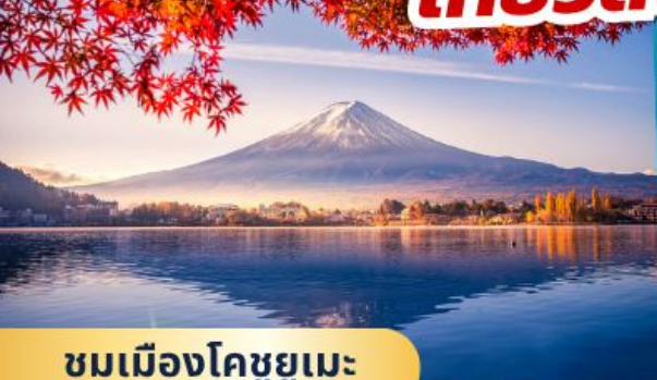
ชมเมืองโคชูยูเมะ