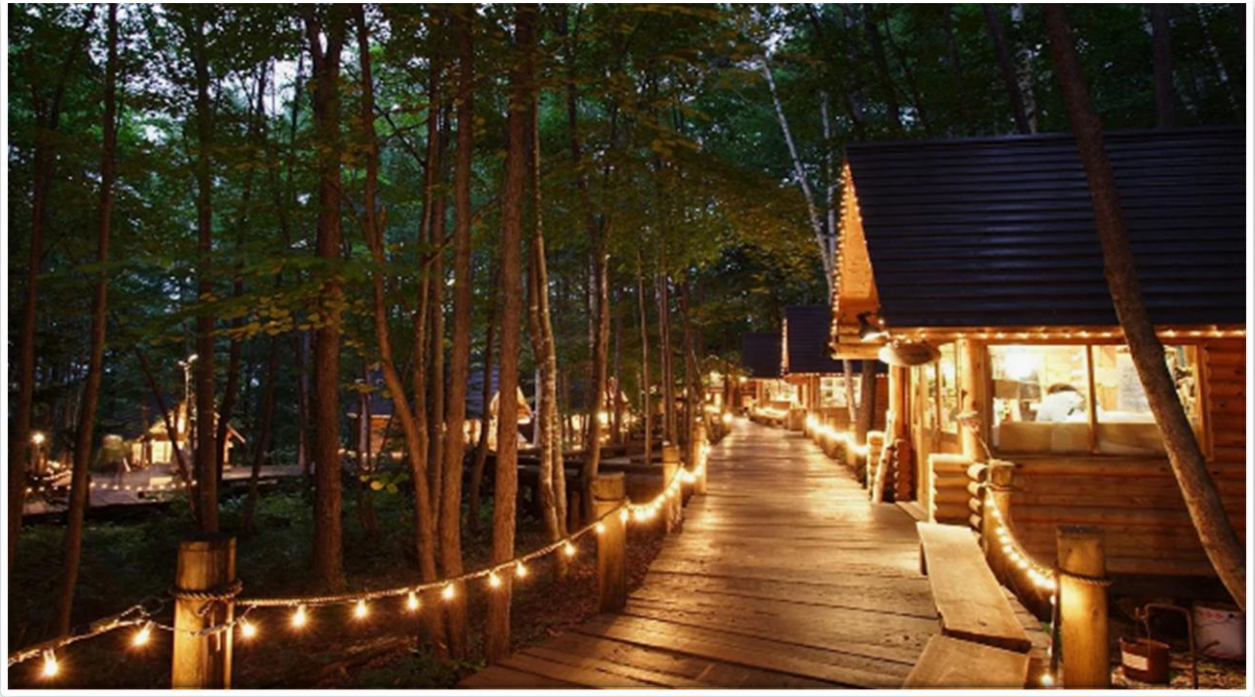
รับประทานอาหารกลางวัน ณ ภัตตาคาร

จากนั้นนำท่านเดินทางสู่ หมู่บ้านนิงเกิลเทอร์ส เป็นหมู่บ้านขนาดเล็ก ๆ ที่บอกเลยว่าของน่าซื้อปิ้งเยาะมากมาย ความดีงามของที่นี่ที่เห็นเด่น ๆ เลยก็ตรงการออกแบบ เพราะรูปแบบของจะให้เป็นกระท่อมไม้เล็ก ๆ ท่ามกลางป่าที่ร่มรื่น เชื่อมต่อกันด้วยสะพานไม้ โดยที่นี่เน้นไปที่สินค้าจำพวกงานฝีมือแฮนด์เมดและสินค้าพื้นเมืองจำพวกงานฝีมือต่าง ๆ