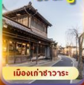
เมืองเก่าซาวาระ