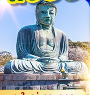
พระใหญ่ คามาคุระ