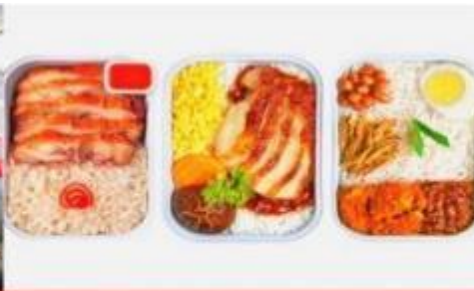
บริการอาหารร้อน ทั้งขาไป-ขากลับ