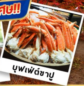
บุฟเฟ่ต์ซาบู