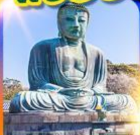
พระใหญ่ คามาคุระ