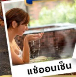
แ่ฮ้อนเซ็น