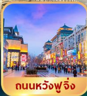
ถนนหวงฟู่จิ่ง