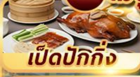
เปิดปักกิ่ง