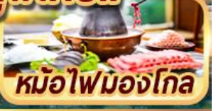
หม้อไฟมองโกเลีย