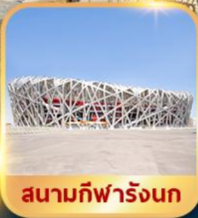
สนามกีฬารังนก