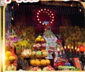
เจ้าแม่กวนอิมสองอำ