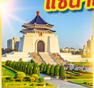
อนุสรณ์เจียงไคเช็ค