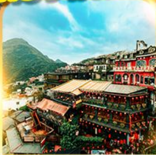
หมู่บ้านโบราณจิวเฟิน