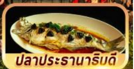
ปลาประรานาริมดี