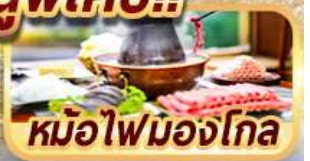
หม้อไฟมองโกล