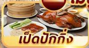
เป็ดปักกิ่ง