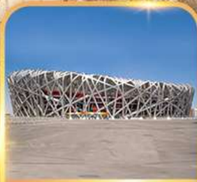
สนามกีฬาρινก