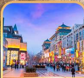
ถนนหวงฟูจิ่ง