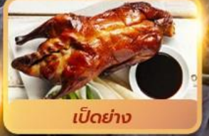
เป็ดย่าง