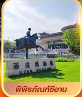
พิพิธภัณฑที่ซีอาน