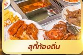
สุกี้ท้องถิ่น