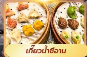
เกี้ยวน้ำซีอาน