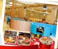
ก๊วยแม่น้ำ + HOTPOT SEAFOOD