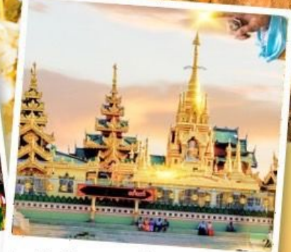
เจดีย์กลางน้ำ (สิเรียม)