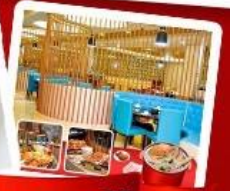
ก๊วงแม่น้ำ + HOTPOT SEAFOOD