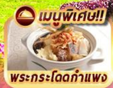
เมนูพิเศษ!! พระกระโดดกำแพง