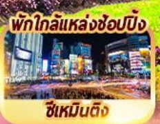
พักใกล้แหล่งช้อปปิ้ง ซีเหมินติง