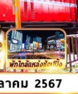
พิกโกลิแหล่งช้อปปิ้ง