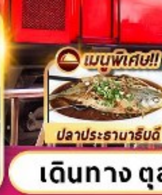
เมนูพิเศษ!!