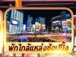
พักใกล้แหล่งช้อปปิ้ง