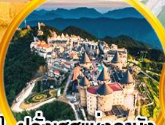
ฝรั่งเศสแห่งดานัง