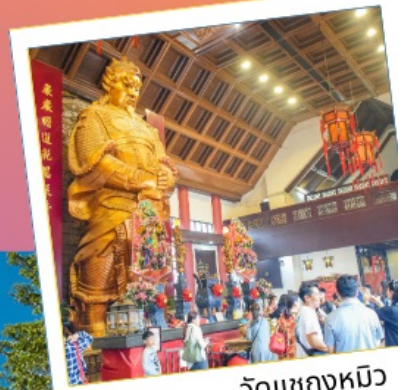
วัดชางกหมิว