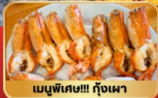
เมนูพิเศษ!!! กุ้งเผา