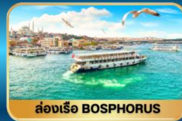
ล่องเรือ BOSPHORUS