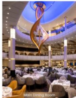
Main Dining Room