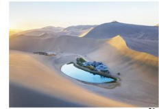
ทะเลทรายหมิงซาซาน ทะเลสาบพระจันทร์เสี้ยว

16.32 น. ออกเดินทางสู่เมืองอู๋หลู่ฟาน ด้วยรถไฟความเร็วสูง ขบวนที่ D55