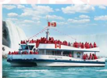
อุทยานแห่งชาติในแควอาร่าฝั่งแคนาดา