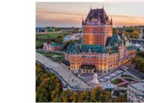
Fairmont Le Chateau Frontenac

** พักที่ Double Tree By Hilton Quebec Hotel 4* หรือเทียบเท่า **