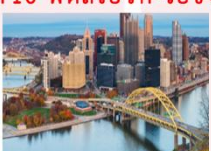
เมืองพิตส์เบิร์ก