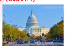
กรุงวอชิงตัน ดี.ซี.

** พักที่ Staybridge Suites Tysons McLean Hotel 4* หรือเทียบเท่า **