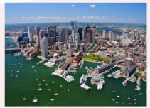
เมืองบอสตัน

** พักที่ Crown Plaza Boston Hotel 4* หรือเทียบเท่า **