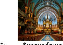
วิหารนอร์ธเทอดาม

** พักที่ Holiday Inn Express & Suites Ottawa Hotel 4* หรือเทียบเท่า **