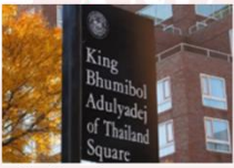
จัตุรัสภูมิพลอดุลยเดช