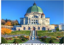
โบสถ์เซนต์โจเซฟแห่งมหานครออต