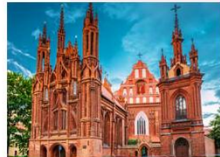
โบสถ์เซนต์แอน