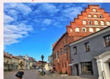
Kaunas Old Town

** พักที่ Holiday Inn Vilnius Hotel 4* หรือเทียบเท่า **