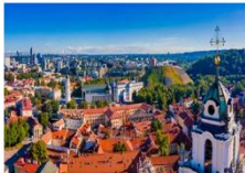
Vilnius Old Town