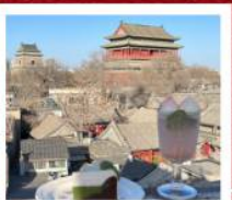
คาเฟ่ น้ำตาล