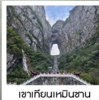
เขากียนเหมินชาน

ฉลองเที่ยวบินปฐมฤกษ์ เก็บครบทุกไฮไลต์!! วันที่ 10 พฤษภาคม 2569 กรุงเทพฯ - อางซา (จางเจียเจีย)