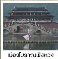
เมืองโบราณฟังหวง