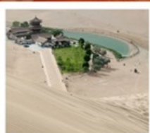
เขื่อนทรายหมิงซาซาน