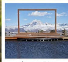
ปาหลางเจียงตู