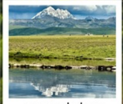
ดวงตาแห่งต่าง

หมู่บ้านทิเบตเจียงจิว • จุดชมวิวกุหลาบหิมะหยา • ปาหล่าง สวนหินปาหล่าง • จุดชมวิวดวงตาแห่งต่าง • วัดมู่หย่า หมู่บ้านเก๋อริ้อหมาซุน • ซินตูเจียง • หมู่บ้านกุ่มงซุน หมู่บ้านปาหล่างเจียงตู • เมืองลอยฟ้าเก๋ดีลามู่ • ภูเขาเจ็ดตัวขา ถนนสายรุ้ง • ทะเลสาบแดง • ถนนคนเดินชอยกว้างแคบ