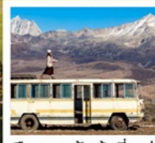
เมืองลอยฟ้าเก๋ดีลามู่

ทัวร์คุณธรรม ไม่ลงร้านช้อปปิ้ง ไม่ขายออฟชั่น