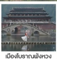
เมืองโบราณฟังหวง