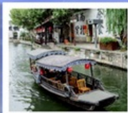
เมืองโบราณหนานสวิน