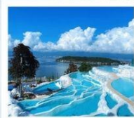
ซานโตรินี่ต้าหลี่