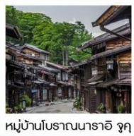
หมู่บ้านโบราณนารายิ จุกุ