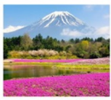
ทะเลสาบโมโตสึ กูงะซังคัมมอส