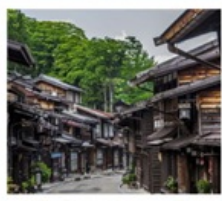
หมู่บ้านโบราณนารายิ จุกุ

หมู่บ้านมรดกโลก ชิราคาวาโกะ / ซันมาจิ ซูจิ / ตลาดซามิยามากาวะ ท่าแพงหิมะเจแปนแอลป์ / คามิโคจิ สะพานคัปเปะ / หมู่บ้านโบราณนารายิ จุกุ สวนโออิชิ ปาร์ค / ทะเลสาบโมโตสึ กูงะซังคัมมอส / วัดฮาเซดะระ / วัดโคโตะคุอิน ศาลเจ้าเนซุ / ห้างเซ็งเคียวคุ บันโร / ซ้อปบิงชินจุกุ