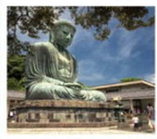
วัดโคโตะคุอิน

SHIRAKAWAGO JAPAN ALPS MATSUMOTO KAMIKOCHI FUJI KAMAKURA