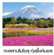
ทะเลสาบโมโตสุ กุ้งพิ้งคิมอส