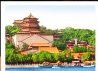
อวิ๋เหอหยวน