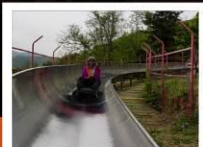
สไลด์เดอร์จากกำแพงเมืองจีน