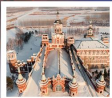
คฤหาสน์วอลคาร์