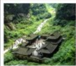
หลุมฝังศพพันสวรรค์

พระพุทธรูปแกะสลักหิน / หมู่บ้านโบราณฉงชิ่ง อุทยานหลุมฝังศพพันสวรรค์ / เรือมังกร / อุทยานนกนางพิน ภูเขาโมก้า / Wulong Flying Kiss / เขื่อนเบิ่งกนบนคันทันเซี่ยฟางเปี่ย เขื่อนเบิ่งหงหยาดัง / มหาศาลประชาชน / เขื่อนไฟฟ้าตงชู่ตัก ถนนโบราณจีนแท้ / ศูนย์หมีแพนด้า