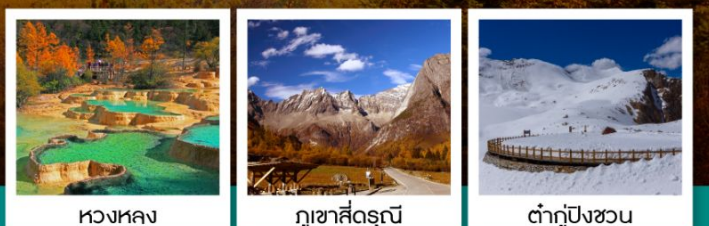
หวงหลง กุหลาบสีดรุณี ต้ากู่ปิงชวน