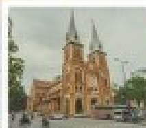
โบสถ์ ดาลัด