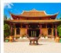
วัดจิมิน