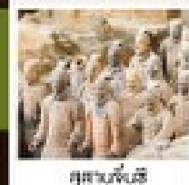
สุถ่าหม่าล่า

วัดสำคัญ / ป่าเจดีย์ / โรงละครแสดงวิทยายุทธสำคัญ / อุทยานหมุนโตซาน ศาลเจ้าทวนอู / กำแพงหลงเหมิน / สุสานทหารพันชี / ถนนคนเดินวัฒนธรรมต้าถิง โชว์ราชวงศ์ถัง / กำแพงเมืองโบราณซีอาน / วัดสาม / ตลาดมุสลิม