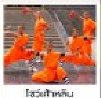
โชว์ราชวงศ์ถัง

PERIOD 1 : 9 - 14 สิงหาคม | PERIOD 2 : 18 - 23 ตุลาคม 2567