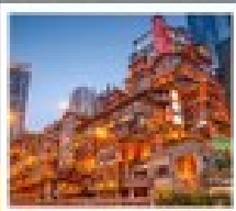
พหลมถิ่ง