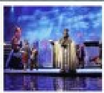
โชว์สามก๊ก

มหาศาลาประชานม / จตุรัสจางเทียนหนาน หลงช่าต้ง / ถนนท่าด่านเจี๋ย / สองเรือสำราญ แม่น้ำแยงซีเกียง โชว์สามก๊ก / สองแถบฮั่วกึ่งเสียบ / สองแถบตุเสียบ / บึงเรือเล็กชมต้นหน้ช ชมเขื่อนสามเสียบฉ่าป้า / บึงคิฟ่าฉ่าเขื่อนสามเสียบฉ่าป้า / พิพิธภัณฑ์เขื่อนสามเสียบ