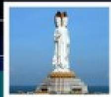
เจ้าแม่กวนอิมทะเล