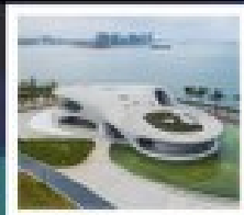
หอสมุดหยุนหลง